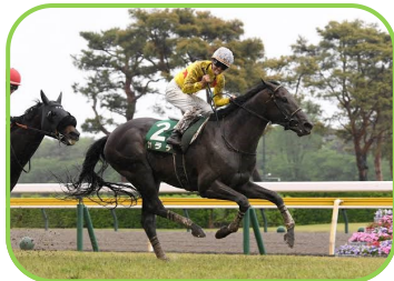
馬名 カラテ 生産者 中地 康弘