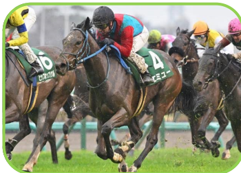
馬名 エミュー 生産者 (株)ノースヒルズ