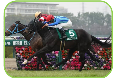
馬名 ララクリスティーン 生産者 土井牧場