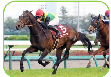
馬名 エエヤン 生産者 (有)須崎牧場