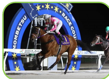
馬名 ケイエイドリー 生産者 (有)隆栄牧場