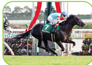
馬名 ヤマニンサルバム 生産者 (株)錦岡牧場