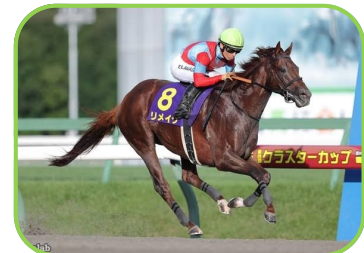
馬名 リメイク 生産者 (株)ノースヒルズ