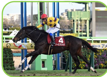
馬名 ノースブリッジ 生産者 (有)村田牧場