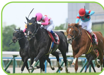
馬名 ダンシンクローパー 生産者 (有)カミイスタット