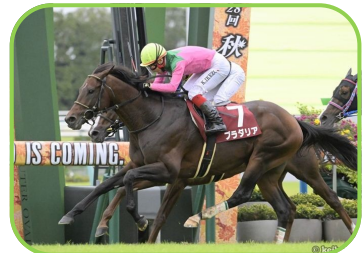
馬名 プラダリア 生産者 (有)オリент牧場