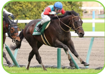
馬名 タマモブラックタイ 生産者 対馬 正