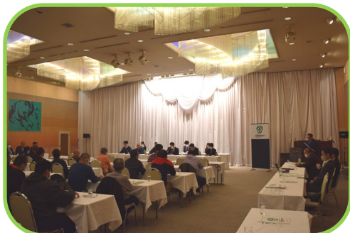
ピーマン生産部会反省会の様子

にいかっぷピーマンの令和5年度の出荷が昨年11月に終了しました。昨年は春先の低温と夏場の高温による急激な気温変化が影響し、作物の収量が減少した地域が多い年となりました。 その状況の中でにいかっぷピーマンは前年を上回る収量と単価を記録し、販売金額が前年を大きく上回り、過去最高額の12億円を突破しました。 昨年12月には、当農協ピーマン生産部会の反省会及び懇親会が12億円突破を記念し、盛大に開催されました。